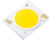
LED CHIP JAPAN